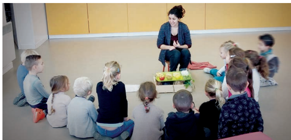
Intervention à l'école de Combas

La Communauté de Communes du Pays de Sommières, soucieuse de soutenir les producteurs locaux et de sensibiliser les jeunes générations sur l'agriculture gardoise s'est associée à la Chambre d'agriculture du Gard pour proposer cette opération à l'ensemble des écoles publiques.